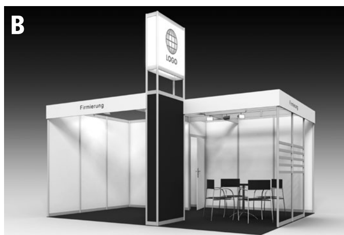
Beispiele: 20-m²-Eckstand | Example: 20 m² corner stand